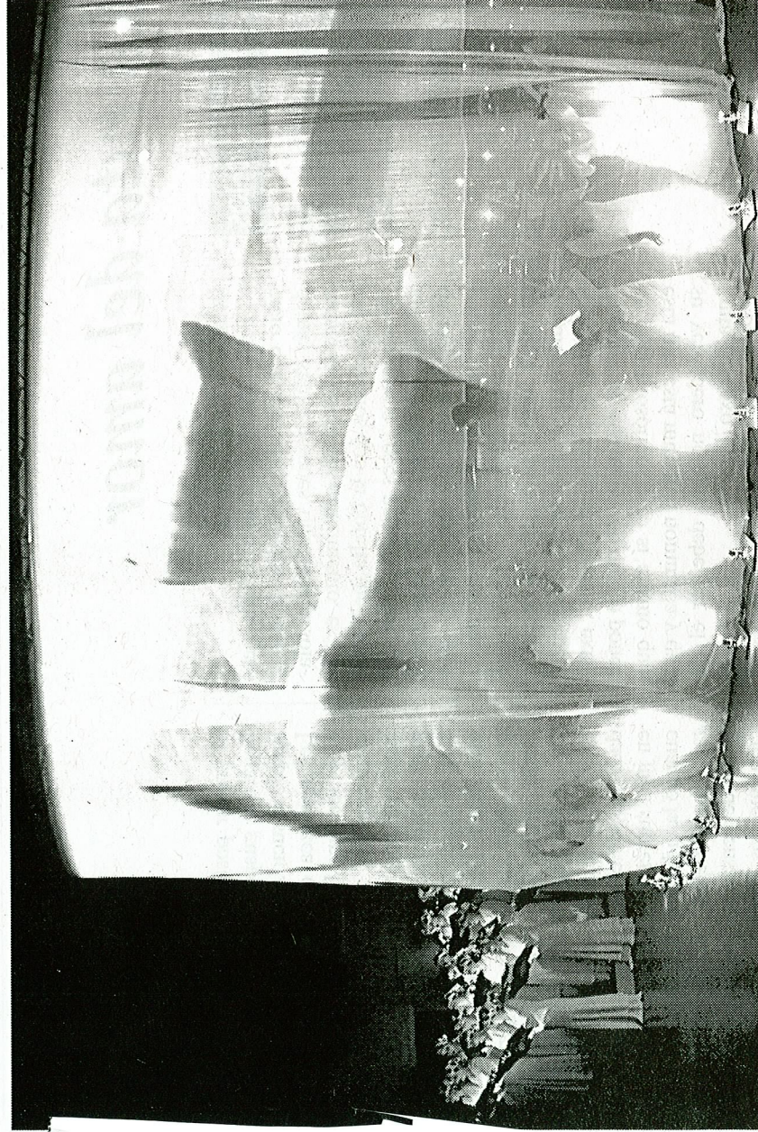
El Orfeón y la Sinfónica de la Región interpretaron juntos hace cuatro años coros de ópera y zarzuela. EL FARO

un poco a la defensiva, hace que todo sea más vistoso, más vivido, más sentido. Esto es lo que nos gusta, lo mejor que nos puede pasar, que lo que sientas te reanime en cierto modo. Nos gusta dar mucha información, implicarnos en todos los sentidos, como en la vida. Que pase algo y que pase dentro de uno.